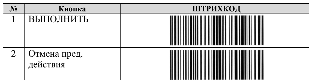
Рис. 3. Печатная форма кнопок согласно значениям штрихкодов.

Добавить в настройки обработки кнопку, выводящую на печать значение штрихкодов для копек «Выполнить» и «Отмена пред.действия» в след. виде: