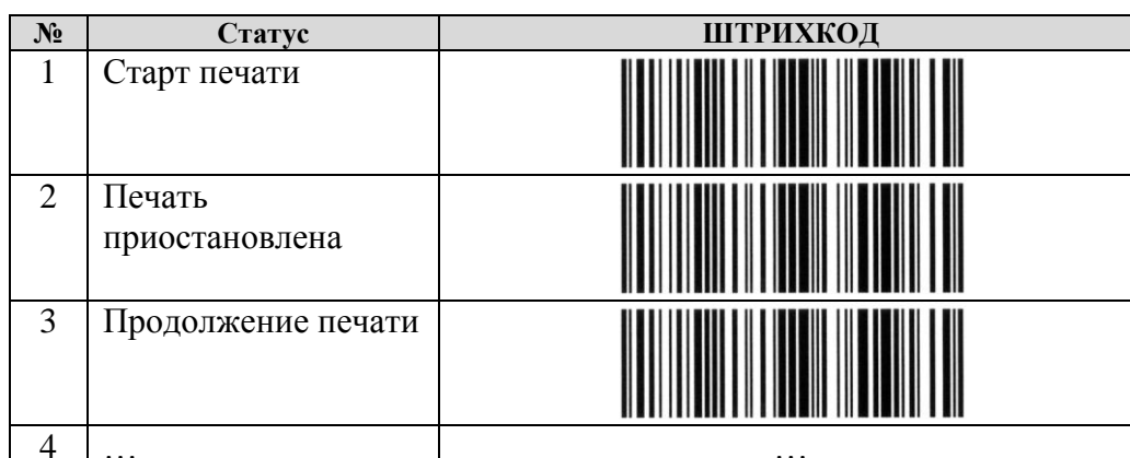
Рис. 1. Печатная форма статусов согласно значениям штрихкодов.

Добавить в форму списка справочника кнопку «Печать» при выполнении которой автоматический выводить все штрихкоды статусов на печать формата А4, согласно след. печатной форме: